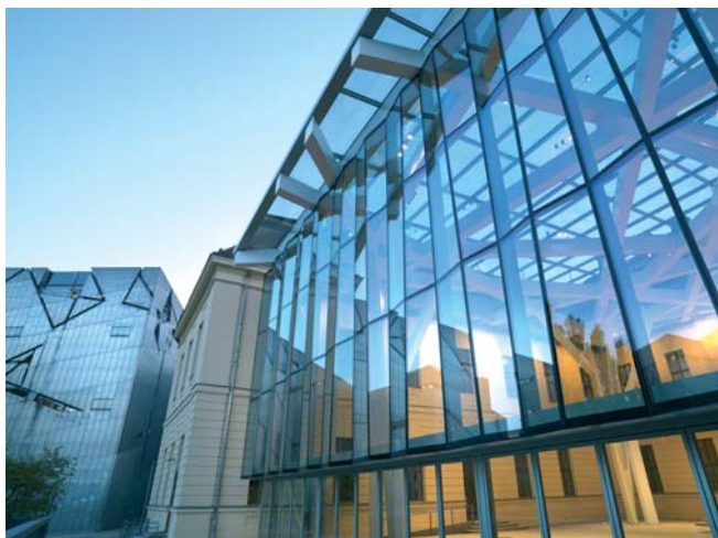
Der Neubau des Jüdischen Museums in Berlin ist der wohl bekannteste Libeskind-Bau in Deutschland