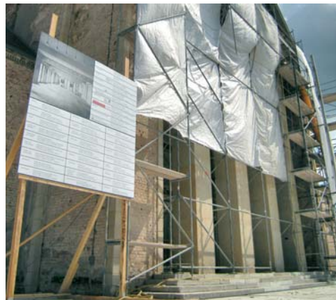
Bauphase 2 am Festspielhaus