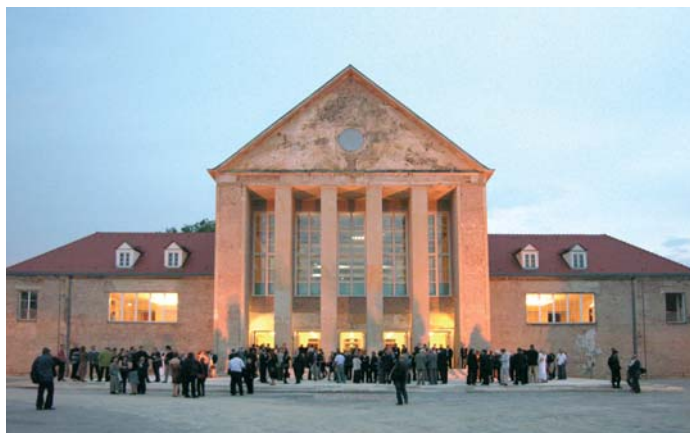
Wiedereröffnung im Stadtjubiläumsjahr 2006

Es dauert noch eine Weile, bis das Herzstück des ‚Grünen Hügels der Moderne‘ ganz in neuem Glanz stehen wird.